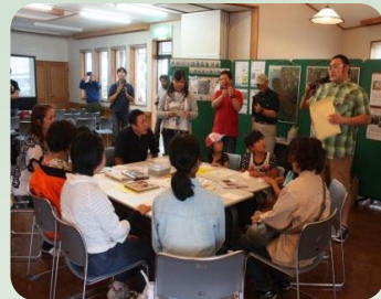
ホッキ祭でのPR活動