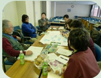
エコモー☆サポーター会議