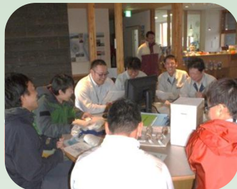
エコモーDayでのPR活動