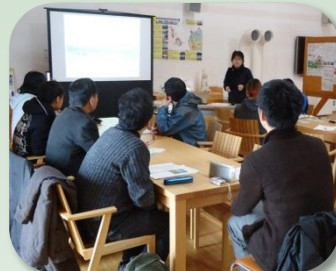
活動報告会の開催